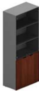
Шкаф высокий 2 глухие дверцы +2 стеклянные дверцы без рам