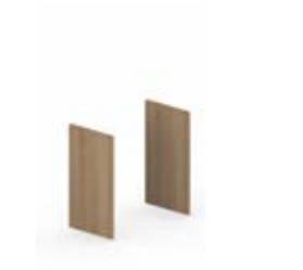
Комплект боковых отделочных панелей