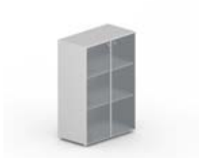
Шкаф средний со стеклом в раме