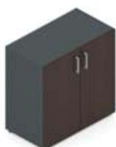
Шкаф низкий с глухими дверцами