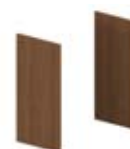
Комплект 2-х боковых отделочных панелей