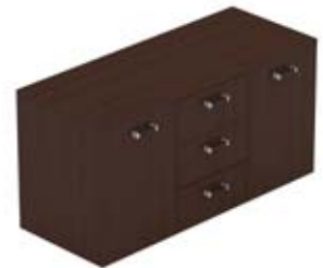
Тумба сервисная 2 дверцы

125 × 50 × 63,5 см LRRM124WE 3 ящика с центральным замком