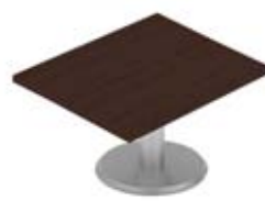
Дополнительная секция переговорного стола