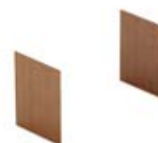
Комплект 2-х боковых отделочных панелей