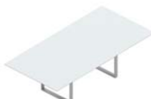
Стол переговорный стеклянная столешница