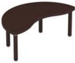
Стол на опорах-колоннах с лицевой панелью