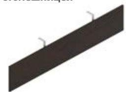
Лицевая панель для столов с меламиновой столешницей