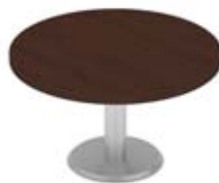
Стол переговорный круглый