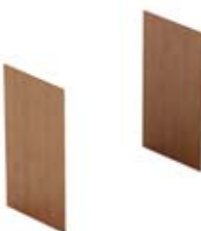
Комплект 2-х боковых отделочных панелей