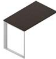
Приставной элемент меламиновая столешница