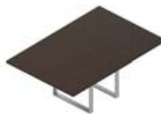
Стол переговорный меламиновая столешница

43,2 × 53,2 × 61 см OCCBR3+отд. 3 ящика с центральным замком