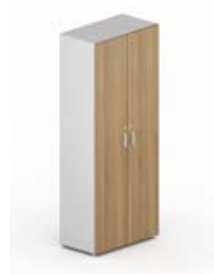
Шкаф высокий гардероб