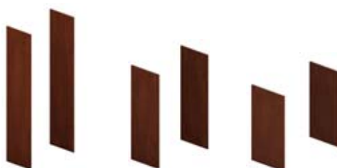
Комплект 2-х боковых отделочных панелей