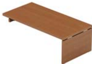
Стол для крепления на сервисную тумбу

180 × 90 см KOPRET180G+отд. левый разворот