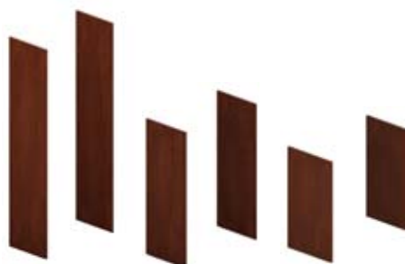
Комплект 2-х боковых отделочных панелей

195 × 44 см BSPA195AJ 118 × 44 см BSPA118AJ 80 × 44 см BSPA080AJ