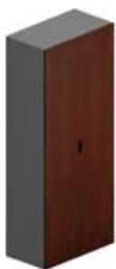
Шкаф высокий 2 глухие дверцы