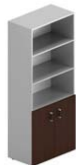
Шкаф высокий комбинированный без стекла