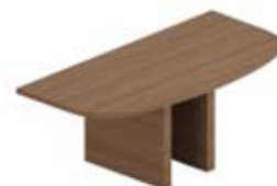
Полукруглый элемент для переговорного стола