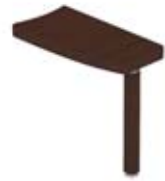
Приставной стол для стола на опорах-колоннах левый