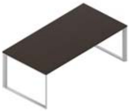
Стол руководителя меламиновая столешница