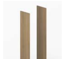
Комплект боковых отделочных панелей