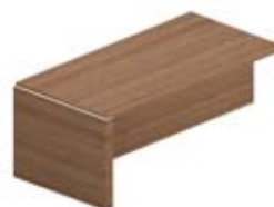
Приставной элемент переговорного стола