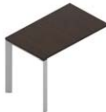
Приставной элемент меламиновая столешница