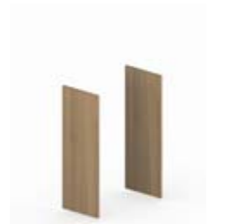
Комплект боковых отделочных панелей