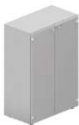
Шкаф средний с матовыми стеклянными дверцами