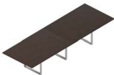
Стол переговорный меламиновая столешница