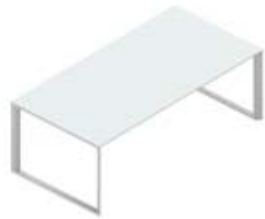
Стол руководителя стеклянная столешница