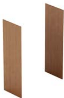
Комплект 2-х боковых отделочных панелей