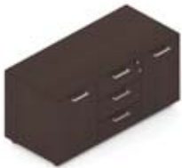
Тумба сервисная 2 дверцы