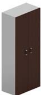
Шкаф высокий с глухими дверцами

125 × 50 × 63,5 см LRRM124WE 3 ящика с центральным замком