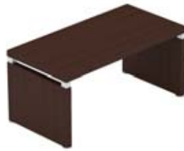
Стол на опорах-панелях с лицевой панелью