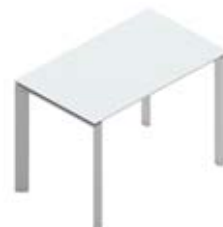
Приставной стол стеклянная столешница