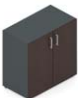
Шкаф низкий с глухими дверцами