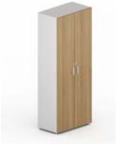
Шкаф высокий 2 глухие дверцы