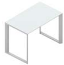
Приставной стол стеклянная столешница