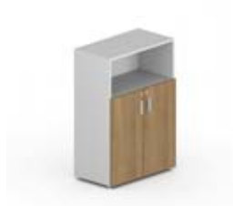
Шкаф средний 2 дверцы + ниша