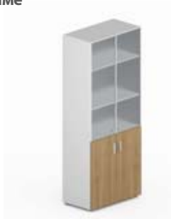
Шкаф высокий комбинированный со стеклом в раме