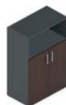
Шкаф средний 2 дверцы + ниша