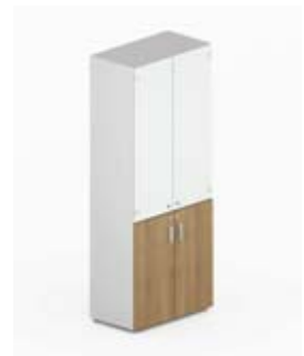
Шкаф высокий комбинированный с матовым белым стеклом