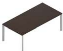
Стол руководителя меламиновая столешница