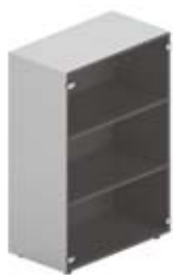
Шкаф средний с тонированными стеклянными дверцами