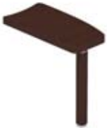
Приставной стол для стола на опорах-колоннах правый