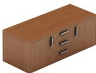
Тумба сервисная 2 двери

134 × 58 × 56 см KOPB153+отд. 3 ящика с центральным замком