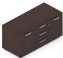
Тумба сервисная 2 дверцы

120 × 53 × 64 см OCB154+отд. 3 ящика с центральным замком