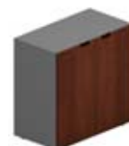
Шкаф низкий 2 глухие дверцы