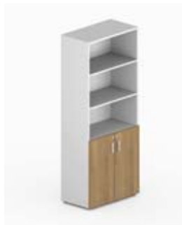
Шкаф высокий комбинированный без стекла