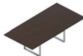
Стол переговорный меламиновая столешница