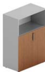
Шкаф средний 2 дверцы + ниша