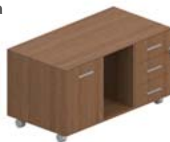
Тумба сервисная 1 дверца +ниша

110 × 57 × 57 см LTB153+отд. 3 ящика с центральным замком