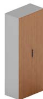
Шкаф высокий гардероб