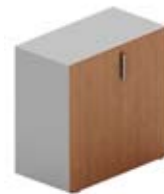
Шкаф низкий с глухими дверцами