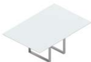
Стол переговорный стеклянная столешница