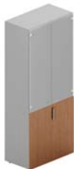
Шкаф высокий с матовым белым стеклом