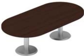
Стол переговорный овальный

42 × 56 × 63,5 см LRСR3WE 3 ящика с центральным замком