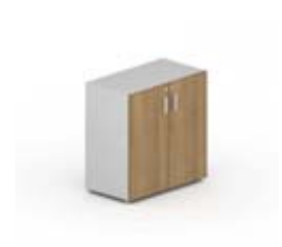
Шкаф низкий 2 глухие дверцы