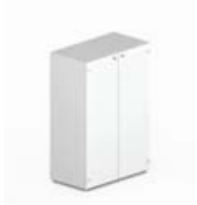
Шкаф средний с матовым белым стеклом