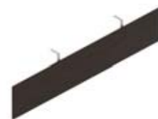
Лицевая панель для стола с меламиновой столешницей