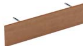
Лицевая панель для стола на сервисной тумбе

180 × 90 см KOPRET180D+отд. правый разворот