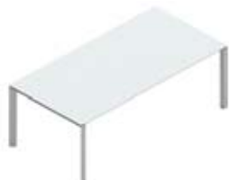
Стол руководителя стеклянная столешница