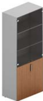
Шкаф высокий комбинированный с тонированным стеклом