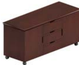
Тумба сервисная 2 дверцы