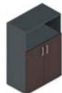
Шкаф средний 2 дверцы + ниша