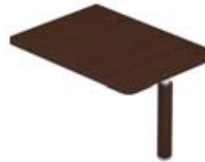
Брифинг-приставка для стола на опорах-панелях