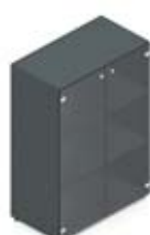
Шкаф средний с тонированными стеклянными дверцами