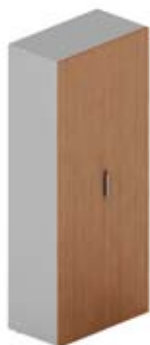
Шкаф высокий для документов 2 глухие дверцы

45 × 58 × 55 см KOPCBR3+отд. 3 ящика с центральным замком