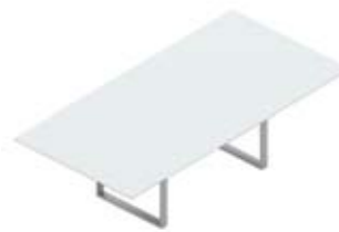
Стол переговорный стеклянная столешница