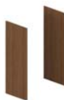
Комплект 2-х боковых отделочных панелей