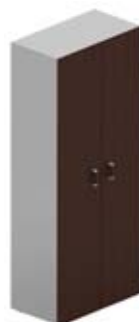
Шкаф высокий гардероб