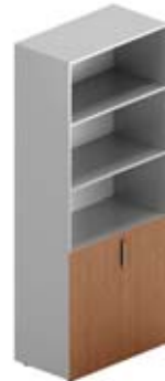
Шкаф высокий комбинированный без стекла