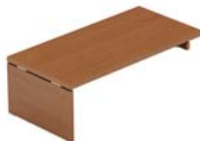
Стол для крепления на сервисную тумбу

180 × 90 см KOPRET180D+отд. правый разворот