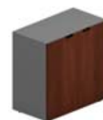
Шкаф низкий 2 глухие дверцы