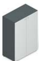
Шкаф средний с матовыми стеклянными дверцами