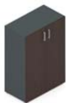
Шкаф средний с глухими дверцами