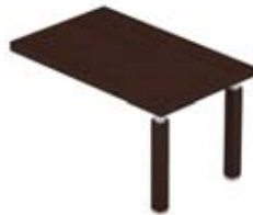
Приставной стол для стола на опорах-панелях